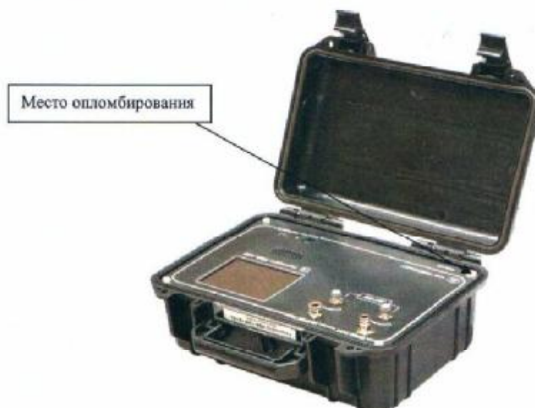
Рисунок 1 - Общий вид гигрометра ИВА-10М

Общий вид гигрометра и схема пломбировки от несанкционированного доступа представлены на рисунке 1.